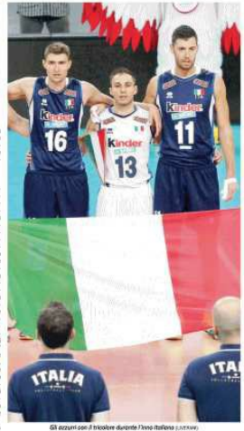
Gli azzurri con il tricolore durante l'Inno Italiano